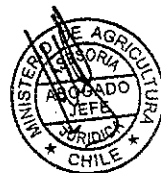
LUIS MAYOL BOUCHON MINISTRO DE AGRICULTURA