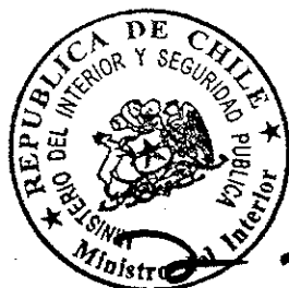
RODRIGO HINZPETER KIRBERG MINISTRO DEL INTERIOR Y SEGURIDAD PUBLICA

Lo que transcribo a Ud. para su conocimiento Saluda atentamente a Ud.